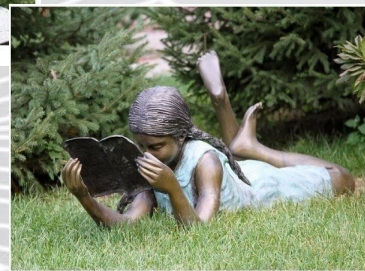
Памятник во Владивостоке, Россия