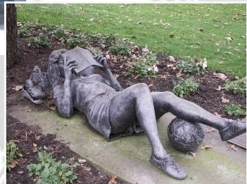
Памятник в г. Вест Лонг Бранч, штат Нью-Джерси, США