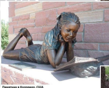
Памятник в Колорадо, США