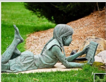
Памятник во Франции